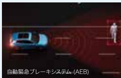
自動緊急ブレーキシステム (AEB)